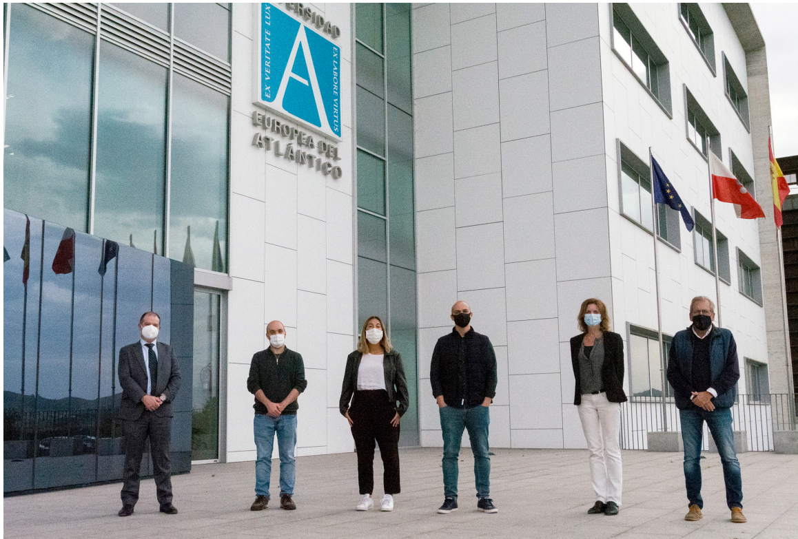
Los participantes en la Décima Ronda de Inversores posan en la Universidad Europea del Atlántico