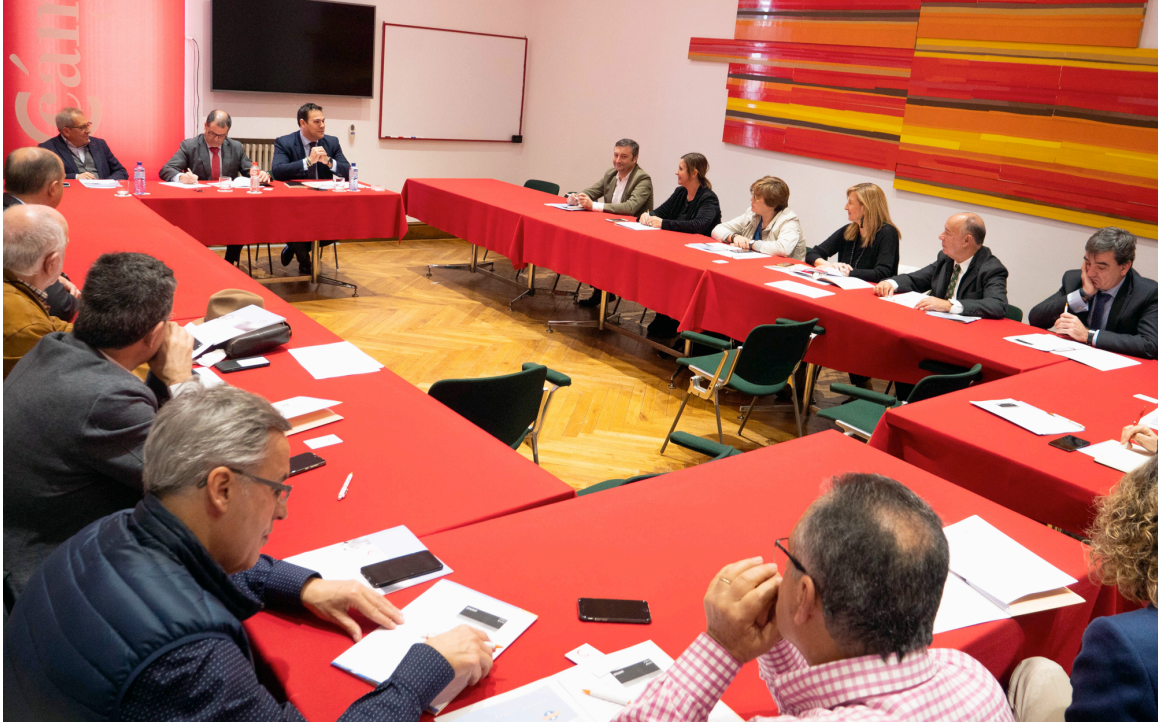
Reunión del Consejo Empresarial de FIDBAN