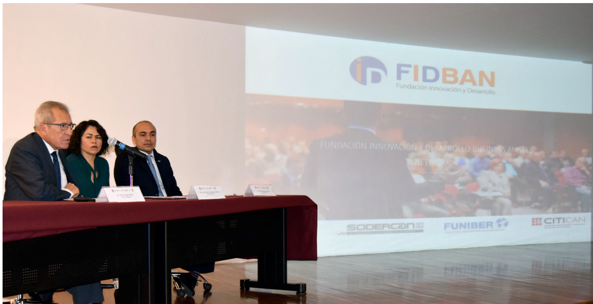
Presentación de FIDBAN en el Instituto Politécnico Nacional de México

FIDBAN mantiene presencia propia en Argentina, El Salvador, Guatemala, Chile, México, Panamá, Perú, República Dominicana, Brasil, Bolivia, Paraguay, Honduras, Costa Rica, Ecuador y Angola. Organizaciones empresariales, Universidades, Centros Tecnológicos, Cámaras de Comercio e instituciones públicas y gubernamentales forman parte activa de los Capítulos de FIDBAN.