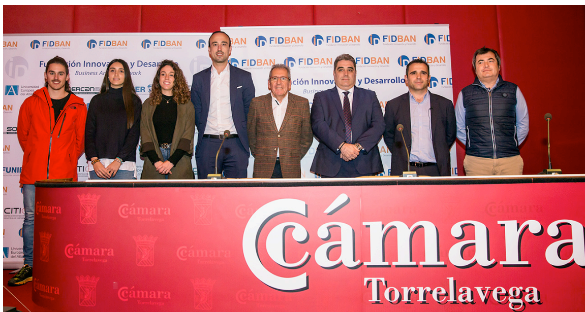
Participantes en la Octava Ronda de Inversores celebrada en la Cámara de Comercio de Torrelavega