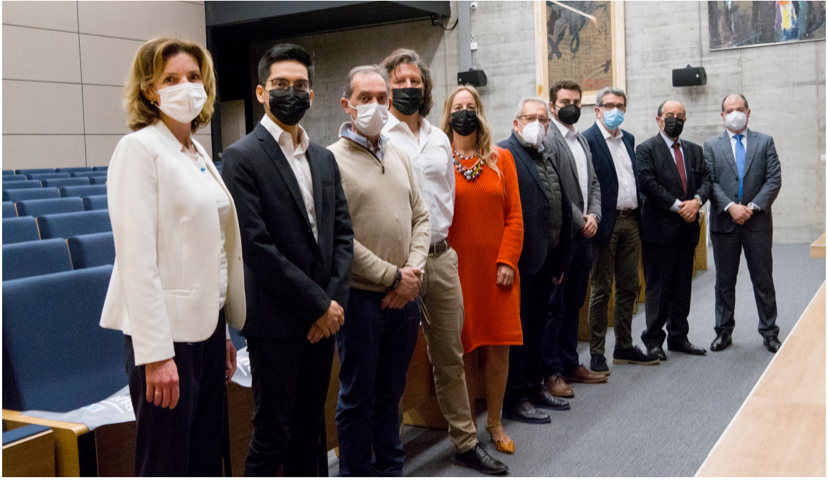
Autoridades y participantes en la Duodécima Ronda de Inversores de FIDBAN