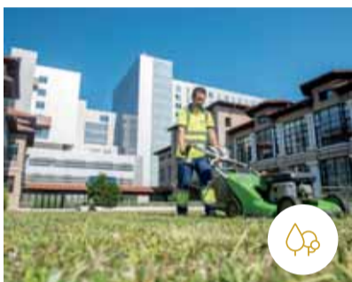
VIALES Y JARDINES