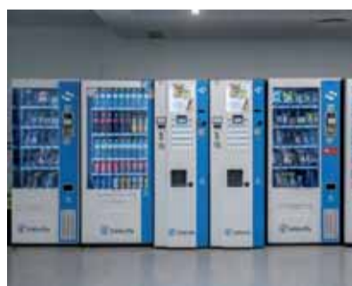
EXPLORACIONES COMERCIALES VENDING