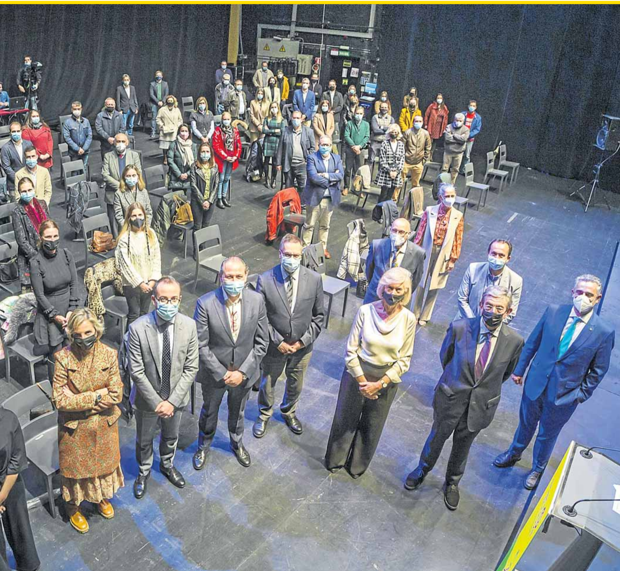
Foto de familia de la gala de presentación, ayer, de la novena edición de STARTInnova.

El concurso organizado por El Diario se divide en cinco fases para que los estudiantes ideen y desarrollen sus propuestas