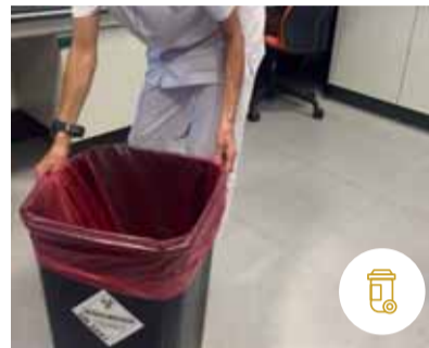
GESTIÓN DE RESIDUOS