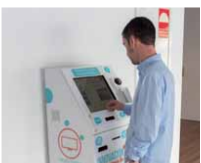
EXPLORACIONES COMERCIALES TV HABITACIONES