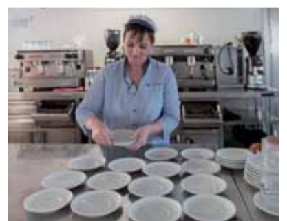
EXPLORACIONES COMERCIALES CAFETERÍA SUR