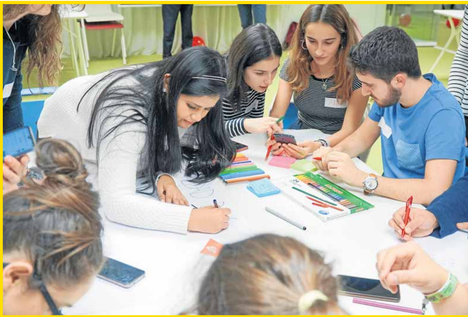
Un grupo de jóvenes estudiantes trabaja en equipo, compartiendo ideas y conocimientos. CISE